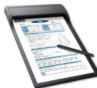
ワコム クリップ ボード 「PHU-111」 (A4 サイズ)

PHU-111 は普通紙に専用のペンで書き込むことでリアルタイムに文書をデジタル化できる手書き入力デバイスです。VQS コラボと組み合わせて利用することで、PHU-111 で普通紙に書き込んだ内容が、遠隔地の VQS コラボのホワイトボード上でリアルタイムに共有できます。